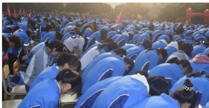
▲ 高三全体学生感恩老师:老师,你辛苦了。