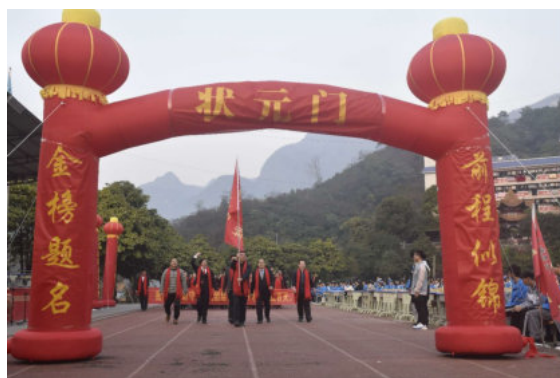
▲ 学校领导老师带领学生走进状元门。