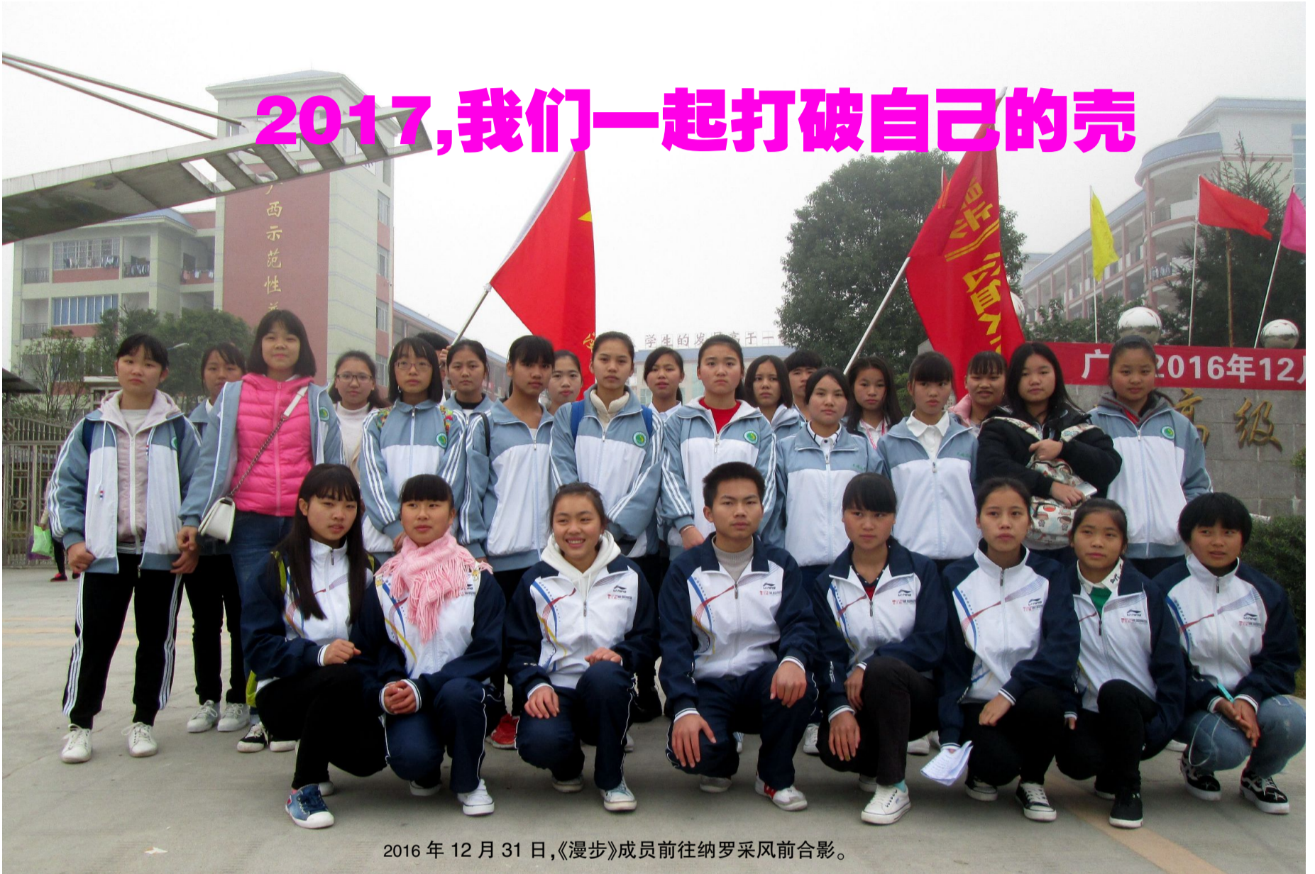
2016年12月31日,《漫步》成员前往纳罗采风前合影。