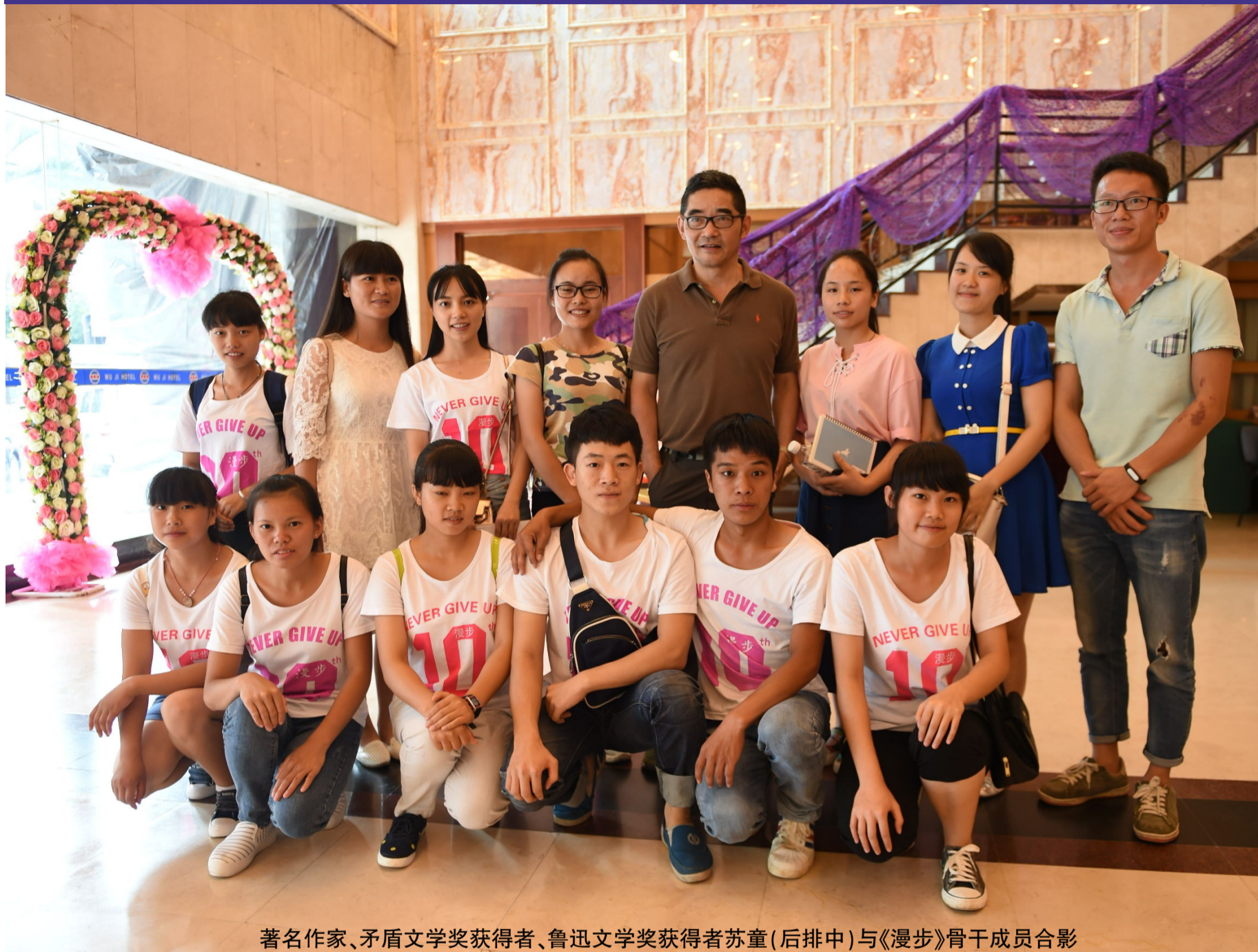
著名作家、矛盾文学奖获得者、鲁迅文学奖获得者苏童(后排中)与《漫步》骨干成员合影